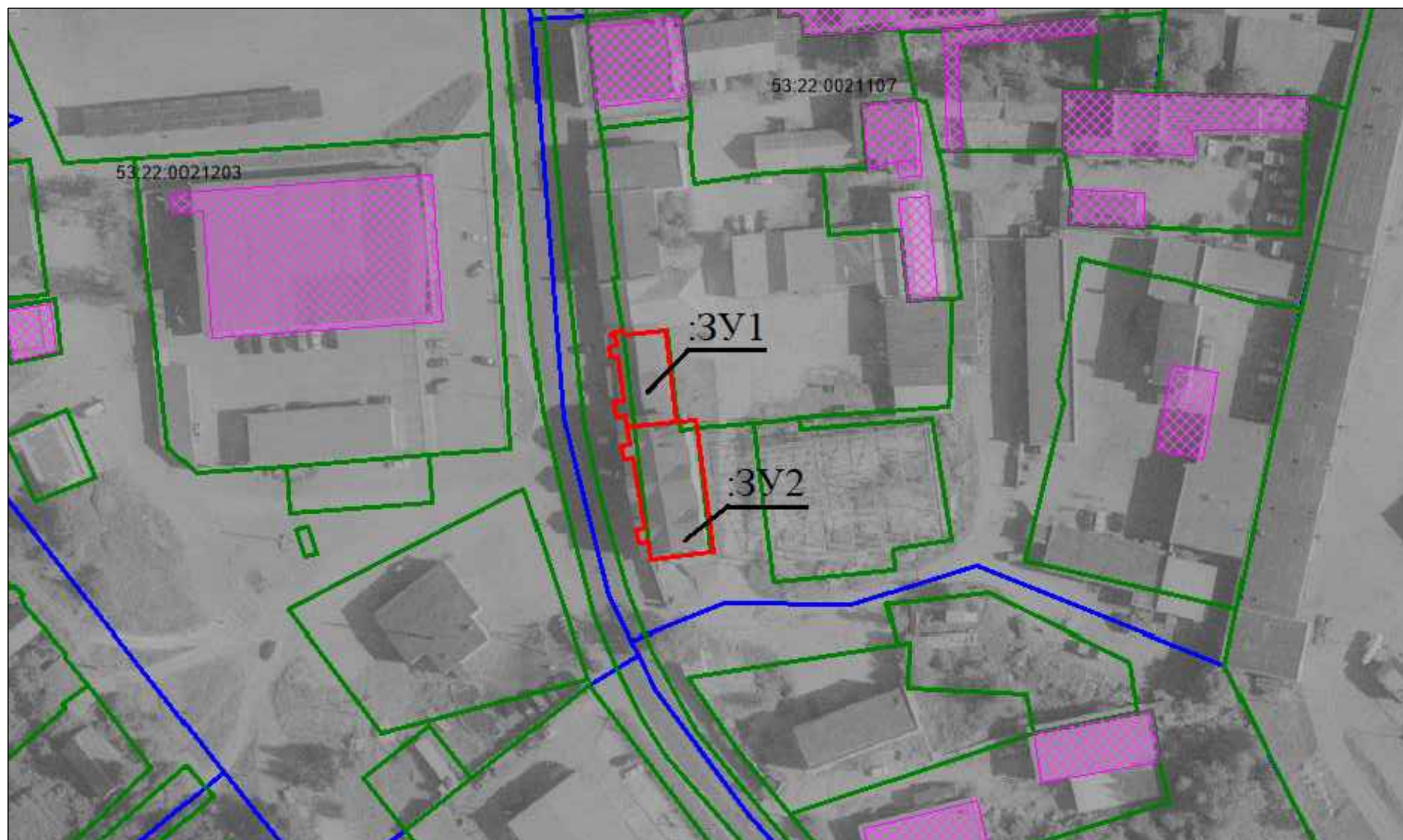
Схема границ существующих земельных участков и объектов кап. строительства