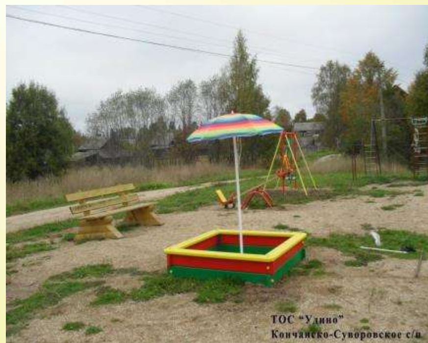
ТОС "Удино" Кончанско-Суворовское с/п