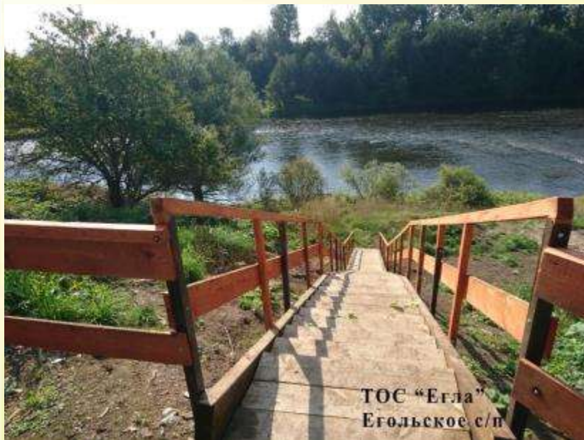
ТОС "Егла" Егольское с/п