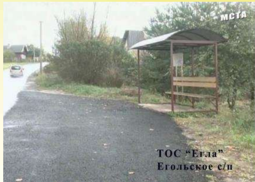
ТОС "Егла" Егольское с/п