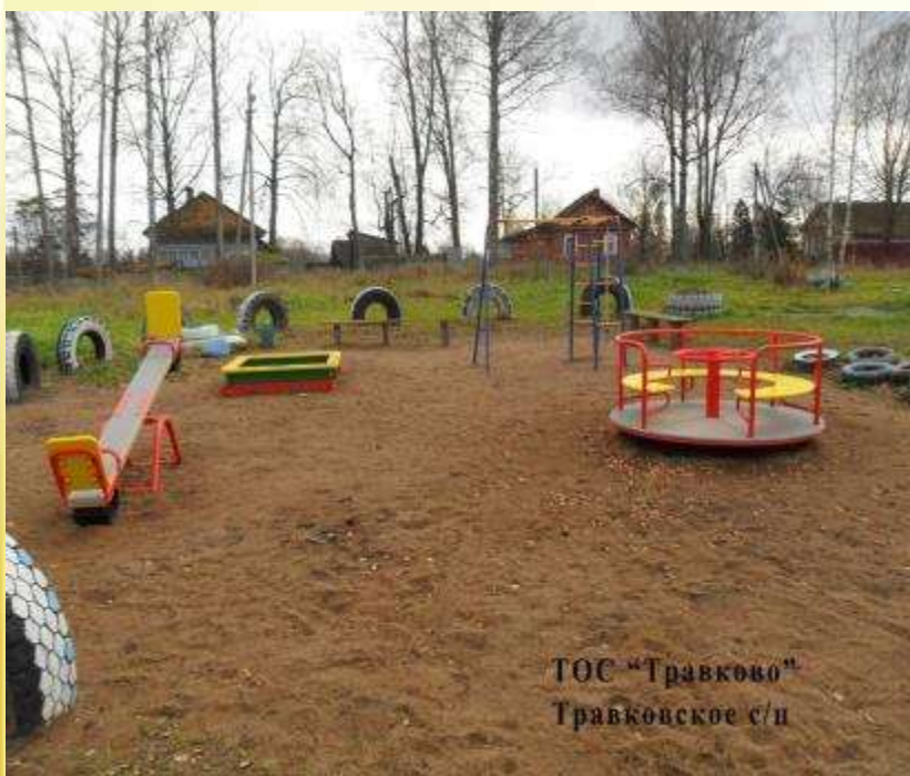
ТОС "Травково" Травковское с/п